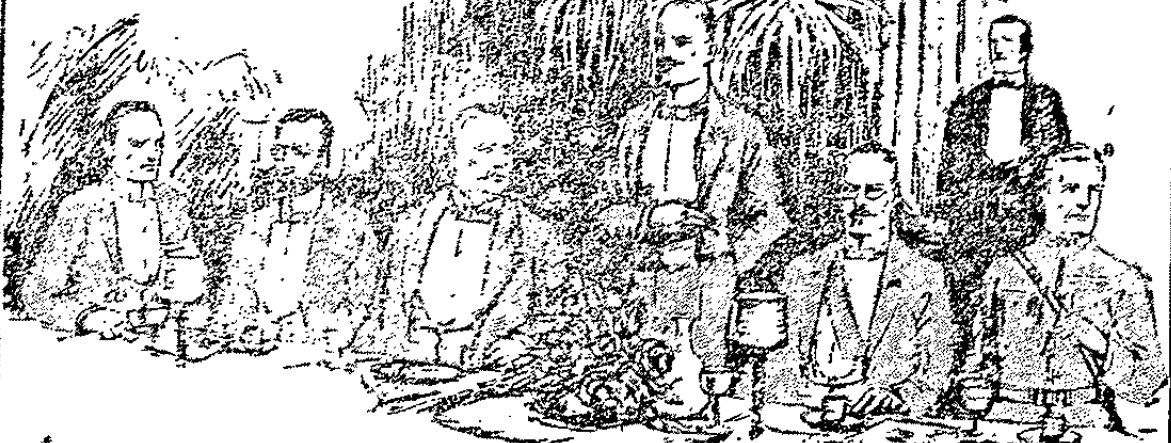
LIGGETT & MYERS TOBACCO CO.